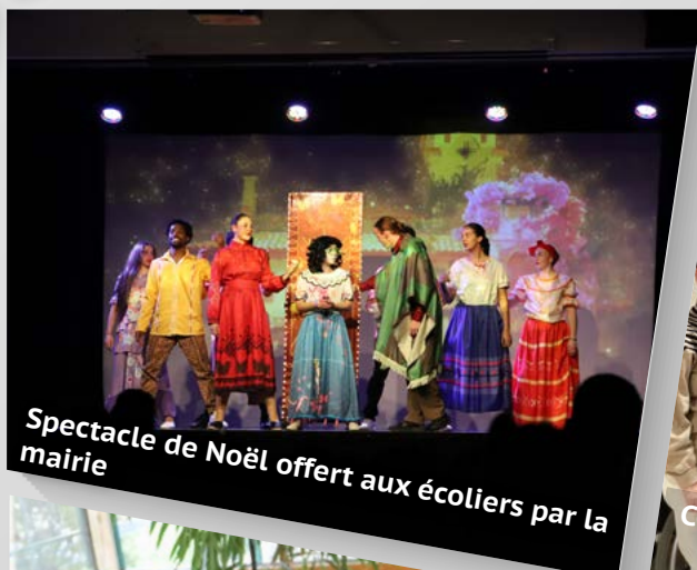
Spectacle de Noël offert aux écoliers par la mairie