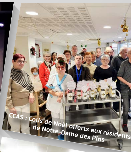
CCAS : Colis de Noël offerts aux résidents de Notre-Dame des Pins