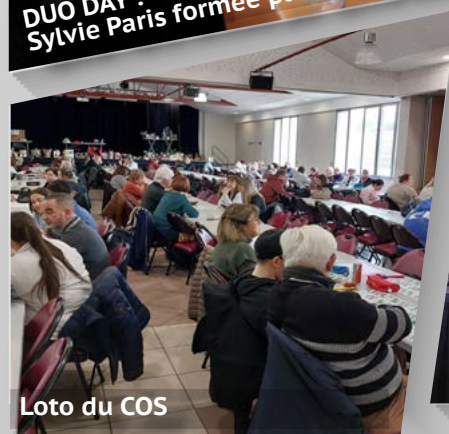
Loto du COS