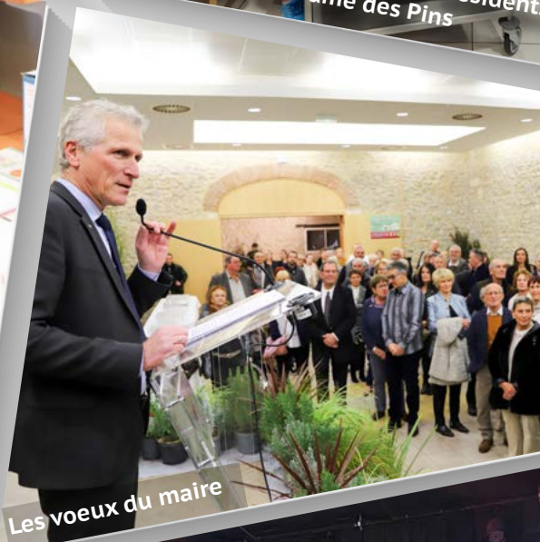
Les vœux du maire