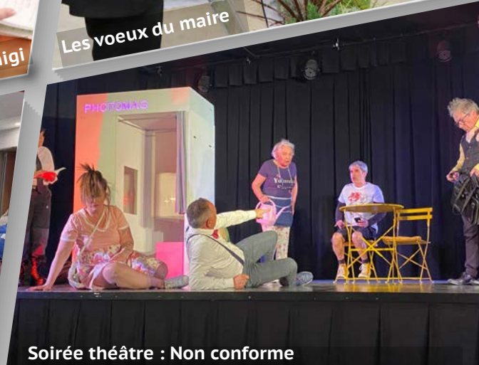
Soirée théâtre : Non conforme