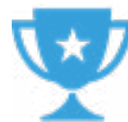
Meilleure photo du concours