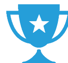
Meilleure photo du concours